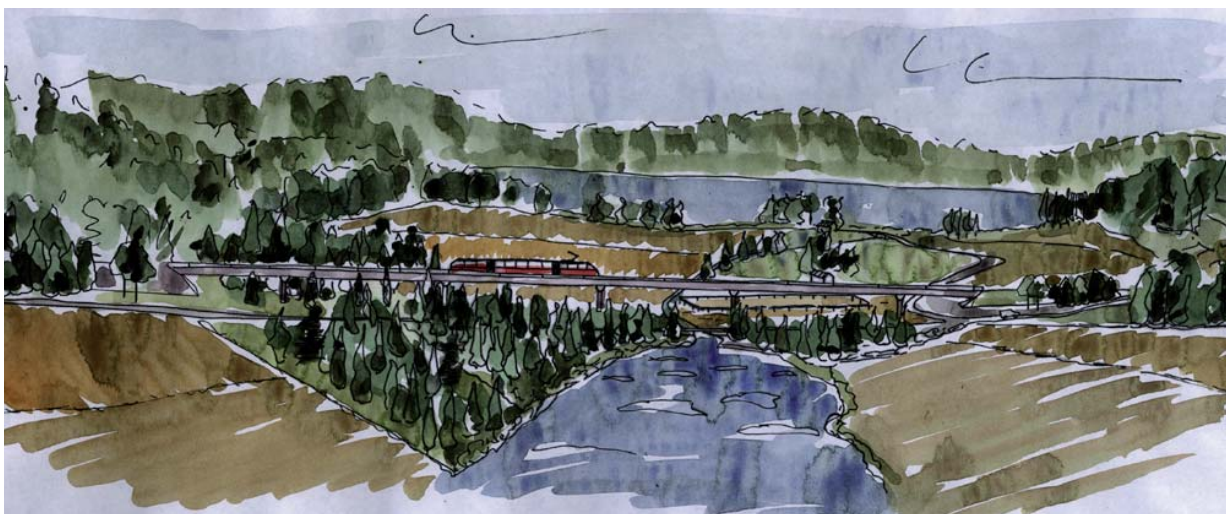
Utredningsalternativ UA4, passagen på bro över Faxens dalgång. Observera att bilden endast visar en möjlig lösning inom den korridor som järnvägsutredningen redovisar. Järnvägens läge i plan och profil kommer att studeras närmare i järnvägsplanen.